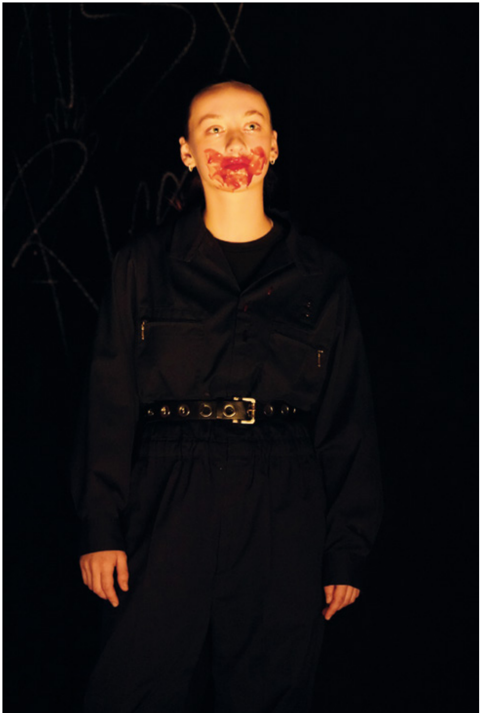
Janne Pauline Böhm »freibaden (AT)« Ein kollektives Eintauchen, Stückentwicklung des 3. Studienjahrs Ensemblepreis 35. Bundeswettbewerb deutschsprachiger Schauspielstudierender, Frankfurt am Main