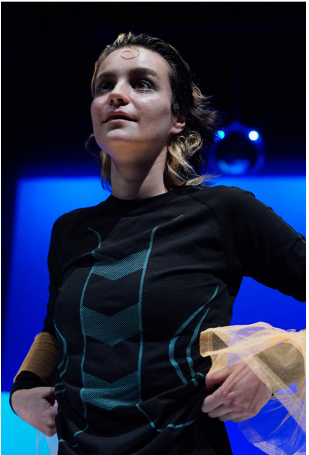
Marix / Maria Turskiy »freibaden (AT)« Ein kollektives Eintauchen, Stückentwicklung des 3. Studienjahrs Ensemblepreis 35. Bundeswettbewerb deutschsprachiger Schauspielstudierender, Frankfurt am Main