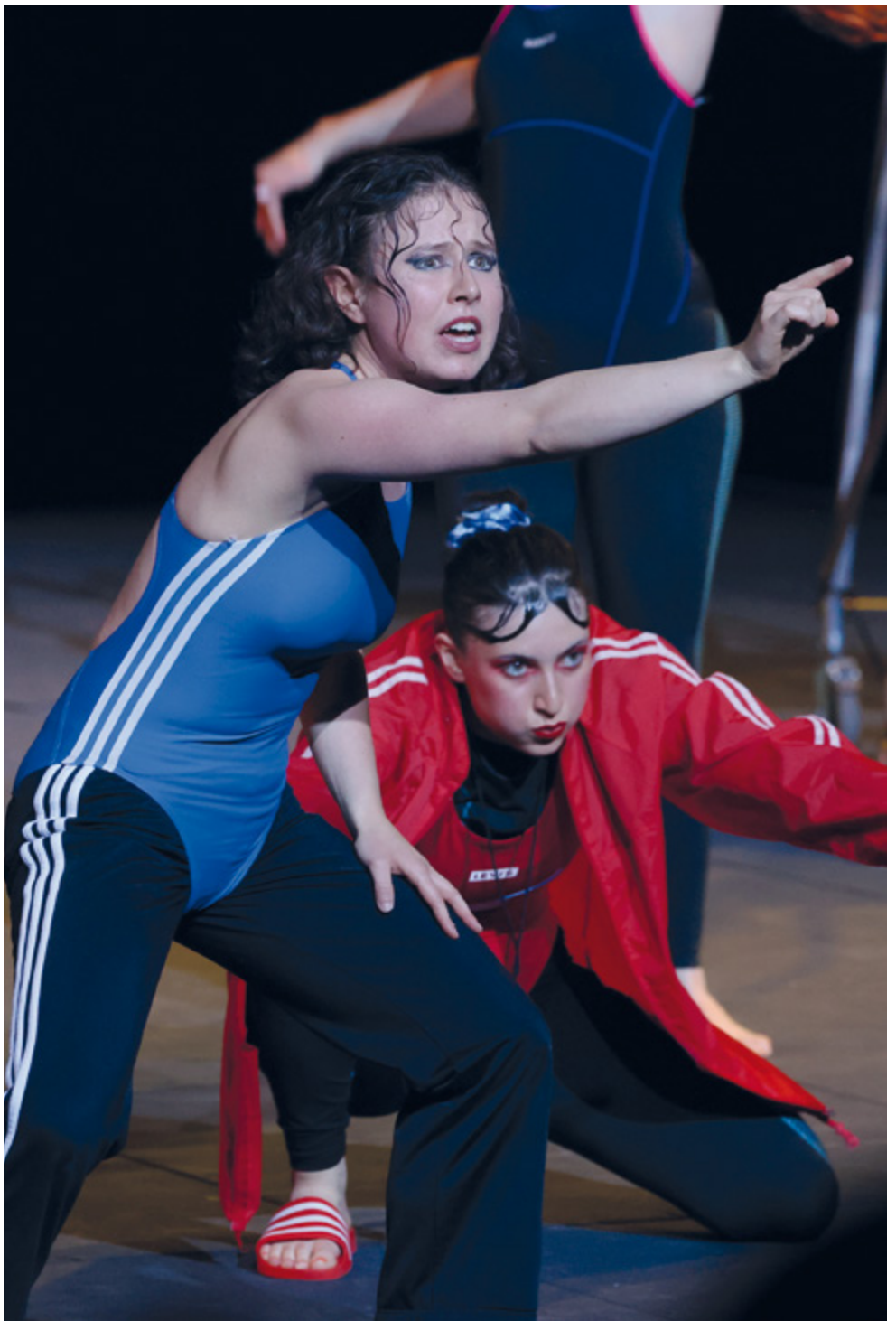
Trigal Sandberger Cañas »freibaden (AT)« Ein kollektives Eintauchen, Stückentwicklung des 3. Studienjahrs Ensemblepreis 35. Bundeswettbewerb deutschsprachiger Schauspielstudierender, Frankfurt am Main